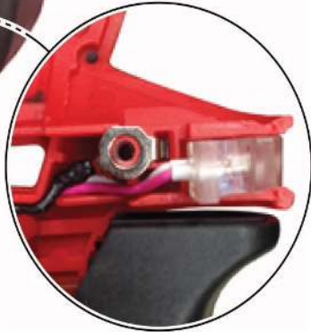
เดินสาย LED และสายดินในช่อง ให้อยู่ ด้านใต้ของห้องเกียร์และตัวปรับซ้าย-ขวา

เดินสายไฟตามรูอย่างระมัดระวัง ให้สายไฟอยู่ในช่อง ด้านหลังของ สวิตช์ตามภาพ